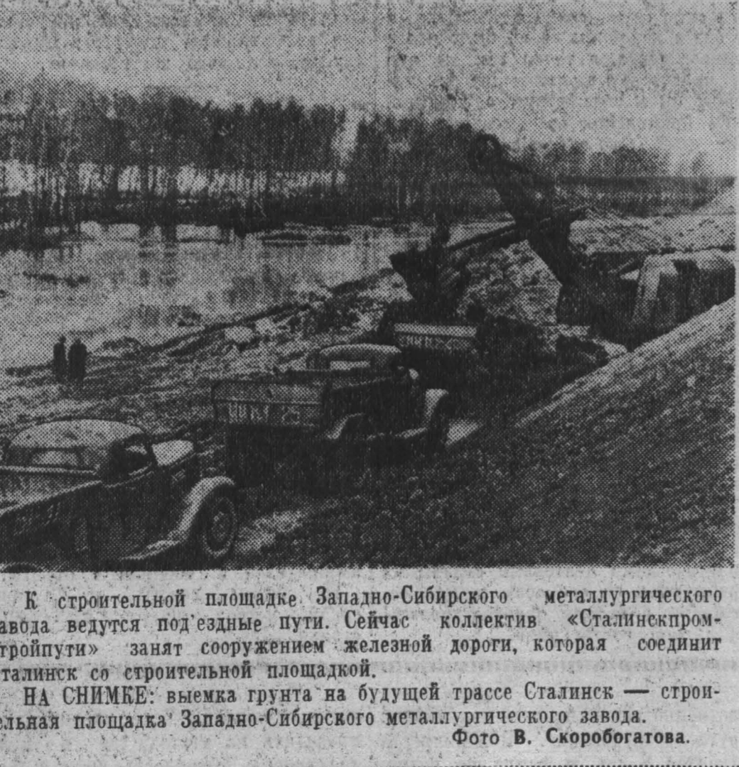
К строительной площадке Западно-Сибирского металлургического завода ведутся подездные пути. Сейчас коллектив «Сталинскпромстройпуть» занят сооружением железной дороги, которая соединит Сталинск со строительной площадкой.

Кемеровскому заводу резиновой обуви на строительство — плотники, штукатуры, камешники, электрики 3 — 4-й группы, слесари, нормировщики, знающие строительство, грузчики.