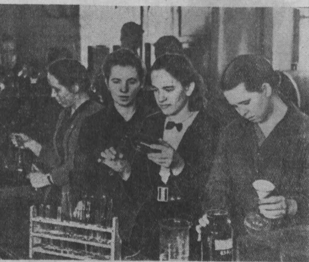
В нынешнем году Анжеро-Судженский химико-фармацевтический техникум сделал свой первый выпуск. Сегодня в техникуме учится около 350 девушек и юношей. Здесь к услугам учащихся — оснащенные лаборатории.

Книгохранилище на 500.000 томов В дни каникул Самая интересная звезда Впереди — футболисты Томска