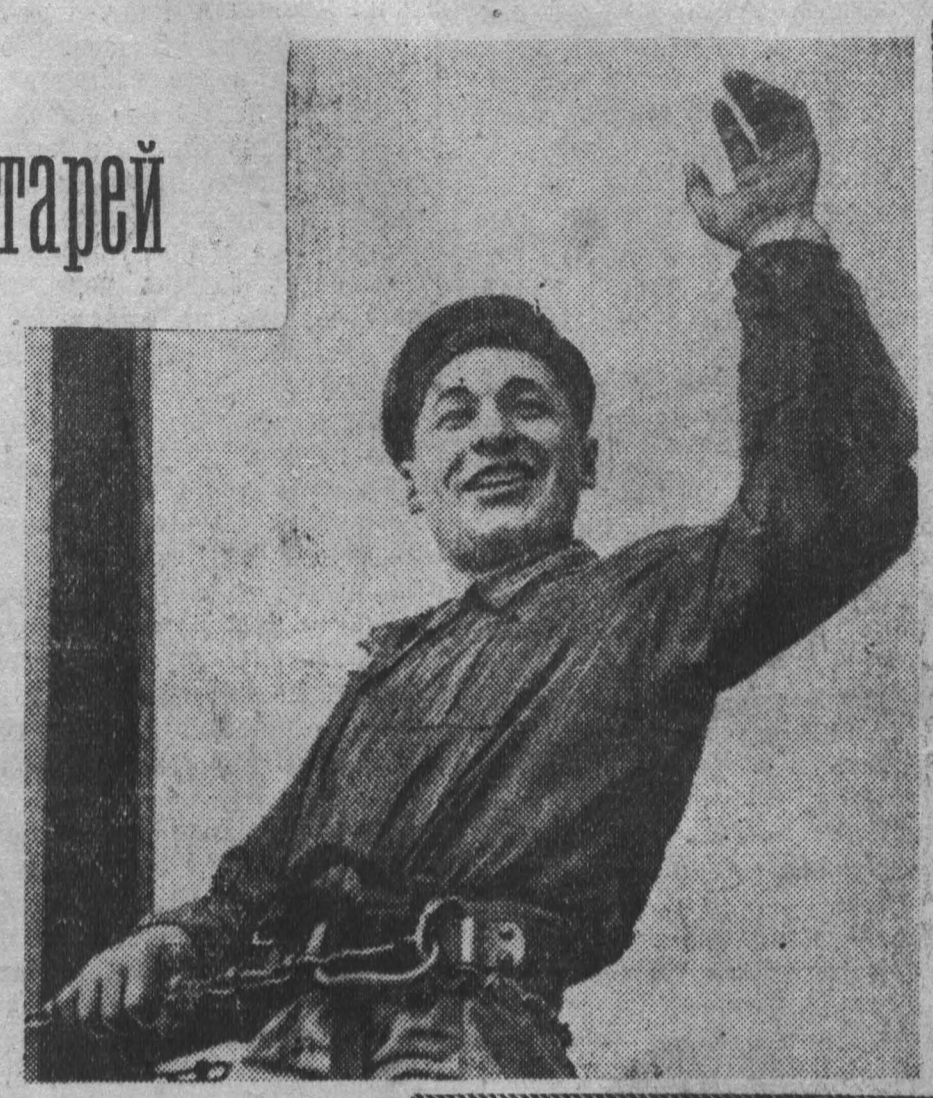
Знакомимся с бригадиром.