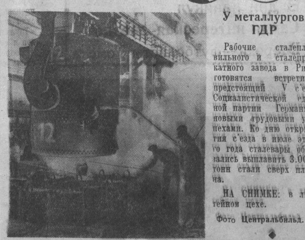
У металлургов ГДР