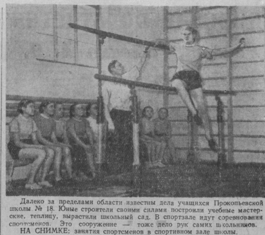
Далеко за пределами области известны дела учащихся Прокопьевской школы № 18. Юные строители своими силами построили учебные мастерские, теплицу, выстроили школьный сад. В спортзале идут соревнования спортсменов. Это сооружение — тоже дело рук самих школьников. НА СНИМКЕ: занятия спортсменов в спортивном зале школы.

В Калининграде начались зональные соревнования на первенство РСФСР по боксу (среди спортсменов северной группы областей и республик РСФСР). В них принимают участие сильнейшие команды Ленинградской, Архангельской, Мурманской, Вологодской, Псковской, Калининградской, Калининградской и северной группы войск.