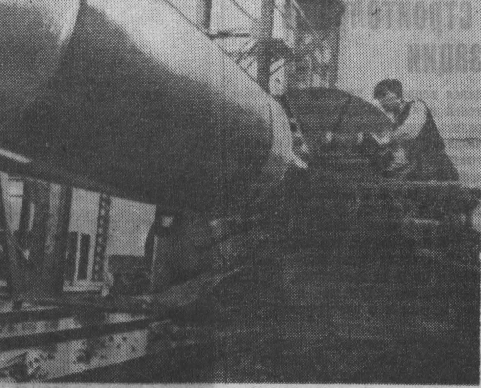
Китайская Народная Республика. Электромашиностроительный завод в Харбине — один из самых современных предприятий страны. Здесь производится крупные автоматические гидротурбины для электростанций. В настоящее время предприятие расширяется. После завершения реконструкции завод станет основным производителем паровых турбин мощностью 25 тысяч киловатт и гидротурбин мощностью 100 тысяч киловатт. НА СНИМКЕ: обработка ротора паровой турбины в 25 тысяч киловатт.

Тревожный характер событий на Корсике подчеркивается в заявлении Политбюро Французской коммунистической партии. В этом документе