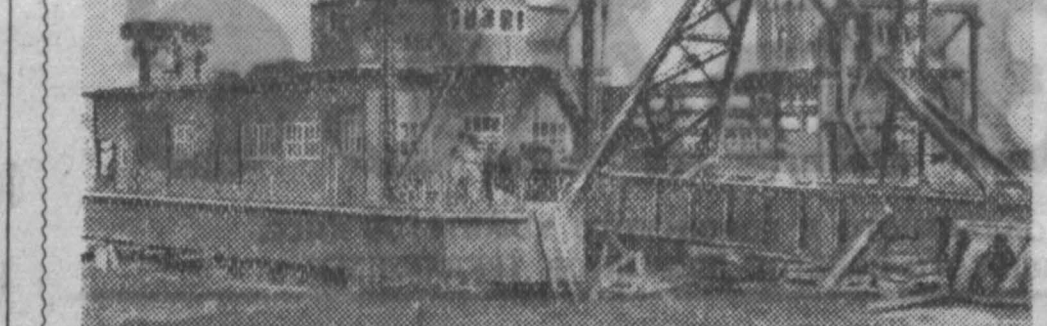
Белгородская область. На железорудных месторождениях Курской магнитной аномалии сооружаются рудники. На одном из них — Лебединском мощностью шесть миллионов тонн руды в год — добыча будет производиться открытым способом. Сейчас на Лебединском месторождении ведутся вскрышные работы. С помощью современной техники — гидромониторов и земснарядов в текущем году из карьера будут вывезены тысячи кубометров грунта. С «Куйбышевгидростроя» и о строительства Кременчугской ГЭС сюда доставлены два земснаряда.

НА СНИМКЕ: монтаж земснаряда на Лебединском карьере. На переднем плане — земснаряд, подготовленный к спуску в забой.