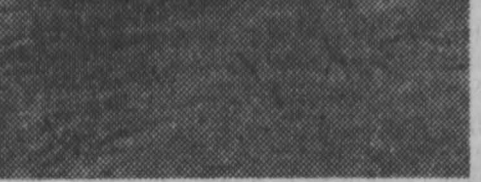
Идет посадка пассажиров. «Южный» отправляется в очередной рейс из Кемерово в Крапивино.

МОЖЕТ быть, это слишком смелое заявление, но мы делаем все для того, чтобы посетители у нас не скушали. Кроме зеленых аллей, цветочных клубов и свежеего воздуха, к открытию сада, которое состоится сегодня вечером, мы готовим кемеровчанам спортивные площадки и комнату с телевизором, аттракционы и библиотеку, Зеленый театр и кинотеатр. Массовые гуляния состоятся у нас и сегодня, и завтра, и в Международный день защиты детей — 1 июня, и в День советской молодежи. Сюда на свой праздник придут шахтеры, строители, железнодорожники. Будут проведены вечера, посвященные Дню физкультурника и Дню Военно-Морского флота. Мы задумали провести циклы интересных лекций, диспуты на тему: «В чем красота человека?», ряд тематических вечеров молодежи в честь исполняющейся нынче знаменательной даты 40-летия комсомола. Приятно, когда вечером,