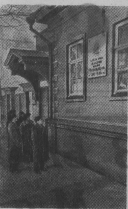
В Ульяновске находится дом, в котором жила семья Ульяновых с 1878 до 1887 года. Тысячи людей со всех концов страны посещают этот Дом-музей. В последнее время значительно увеличился поток посетителей.

А. МЫТАРЕВ, докцент Сталинского института,