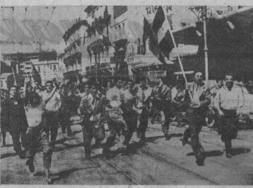
Греция. Недавно в Афинах большая группа студентов организовала демонстрацию. Юноши несли греческие национальные флаги и выкрикивали антианглийские лозунги. Полиция разогнала демонстрантов. НА СНИМКЕ: демонстранты на одной из улиц Афин.