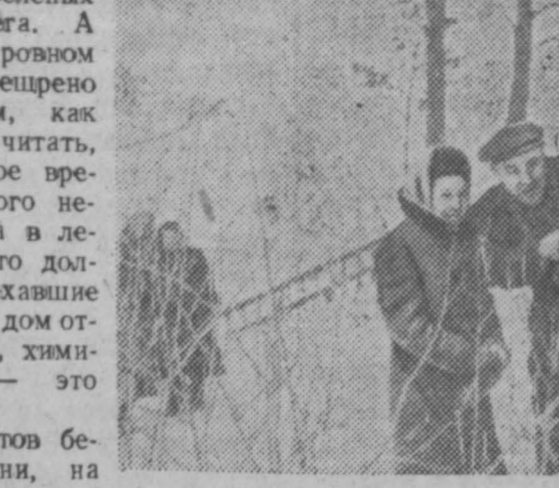
Здесь, в глубине леса, тихо, безветренно, сосны и ели крепко держат в своих зеленых лапах комья снега...