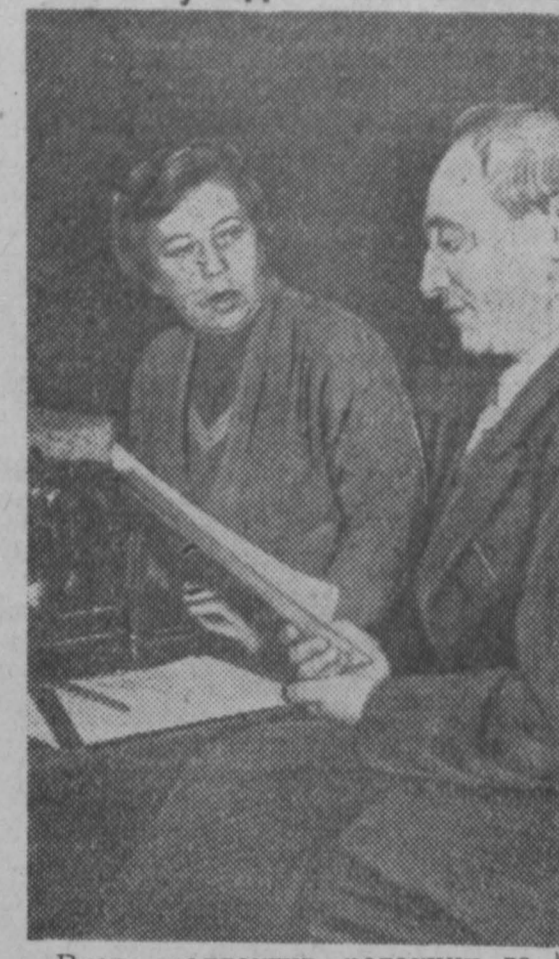
Вчера коллектив редакции газеты „Кузбасс“ проводил за заслуженный отдых на пенсию, своих старейших сотрудников...