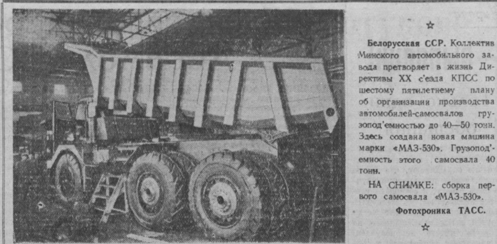
Белорусская ССР. Коллектив Минского автомобильного завода превращает в жизнь Директивы XX съезда КПСС по шестому пятилетнему плану об организации производства автомобилей-самосвалов грузоподъемностью до 40—50 тонн. Здесь создана новая машина марки «МАЗ-530». Грузоподъемность этого самосвала 40 тонн.