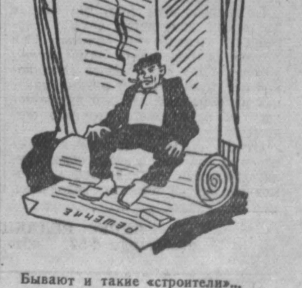
Бывают и такие «строители».