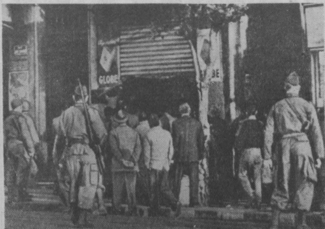
В Алжире состоялась всеобщая забастовка, объявленная в поддержку требования о предоставлении стране национальной независимости. Несмотря на попытки колониальных властей подавить забастовочное движение (массовые аресты, предание военному суду, увольнение бастующих с работы), алжирские патриоты не прекращают борьбы.

Долгосрочным соглашением предусматривается значительное увеличение из года в год объема товарооборота между СССР и Францией и расширение номенклатуры взаимопоставляемых товаров; ожидается, что к концу трехлетнего периода товарооборот между двумя странами достигнет уровня, превышающего примерно в три раза объем товарооборота 1955 года.