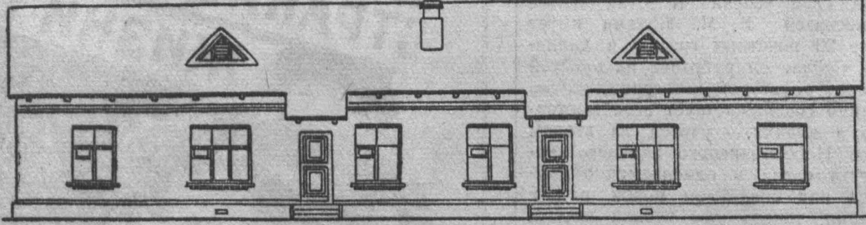
Фасад четырехквартирного дома.

В городе Кемерове ведется энергичная подготовка к строительству жилья собственными силами. Большое место сейчас отводится проектной работе. В настоящее время Кемеровским обл. проектом разрабатывается серия одноэтажных блочных домов для самостоятельного строительства. Проектируя их, мы стремимся прежде всего максимально удешевить стоимость квартир, снизить трудоемкость работ. Вместе с тем дома по своему архитектурному образцу, внутренней планировке, наличию светлых помещений, передних, парадных входов, ванн и санитарному оборудованию предусматривают значительное улучшение жилищно-бытовых условий трудящихся.