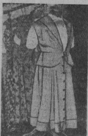
НА СНИМКЕ: одна из новых моделей.