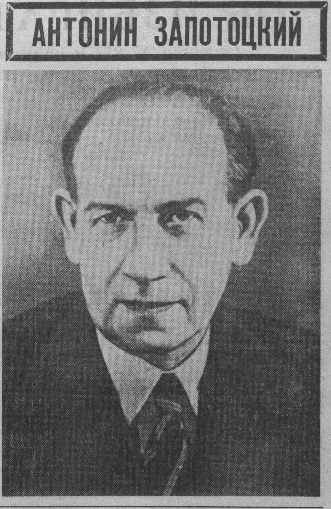
АНТОНИН ЗАПОТОЦКИЙ От Центрального Комитета Коммунистической партии Советского Союза, Президиума Верховного Совета СССР и Совета Министров Союза ССР

Эти мысли сегодня — всеобщие. Документы Верховного Совета СССР, его Обращения находят среди шахтеров, как и среди всего народа нашей страны, самый горячий, энергичный, волнующий отклик. Ю. БАЛАНДИН.