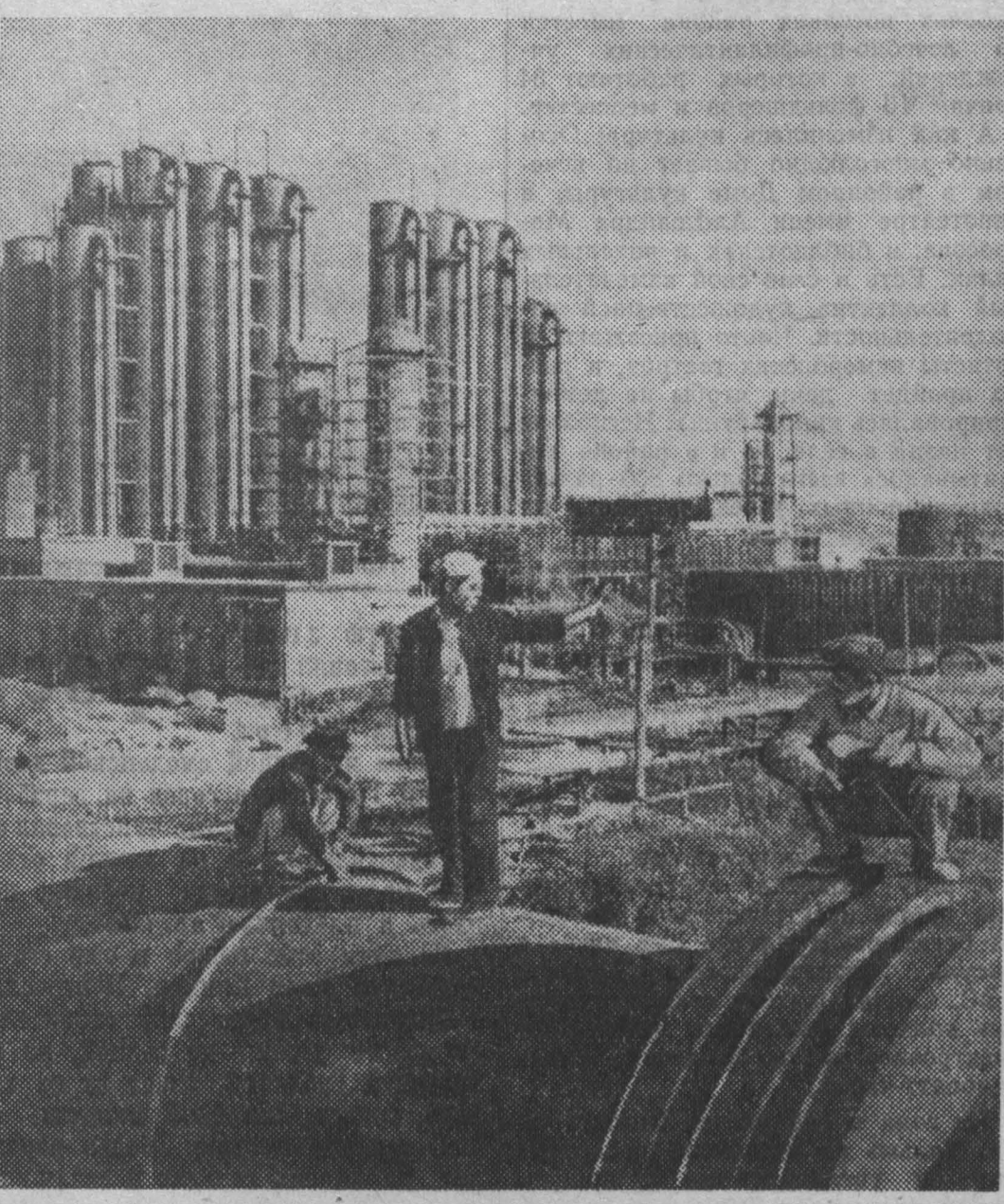
Китайская Народная Республика. Крупнейший на северо-востоке страны центр угольной промышленности Фушунь за годы народной войны стал также крупным нефтяным центром Китая. НА СНИМКЕ: один из производственных объектов нефтеочистительного завода № 2.