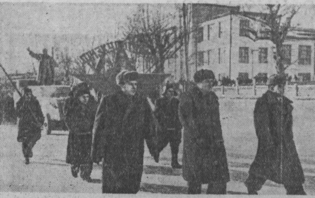
Демонстрация трудящихся гор. Анжеро-Судженска 7 ноября 1957 г.