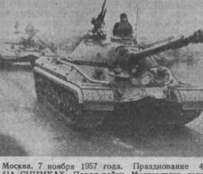
Москва, 7 ноября 1957 года. Празднование 40-летия Великой Октябрьской социалистической революции. НА СНИМКАХ: Парад войск Московского гарнизона. Ракетная техника на Красной площади.

Период обращения второго спутника равен 103,52 мин. Он уменьшается значительно медленнее. За один сутки уменьшение периода обращения второго спутника составляет 2,3 секунды. Наибольшая высота его орбиты равна 1,650 километрам.