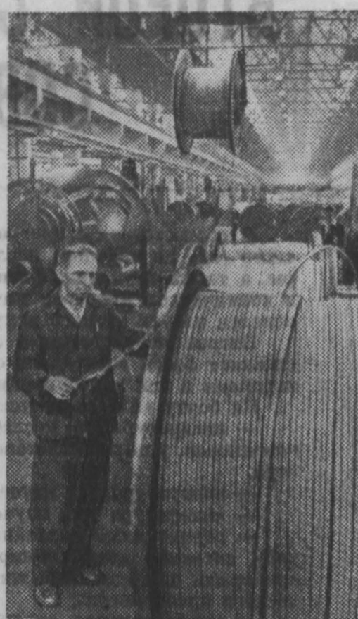
Москва. Коллектив завода «Москва» соревнуется в честь 40-летия Великого Октября. Активно участвуя в социалистическом соревновании, многие производственники предприятия систематически перевыполняют сменные задания и выпускают продукцию отличного качества. НА СНИМКЕ: в цехе сыловых кабелей.

П. БЕКШАНСКИЙ, М. СТОЙКЕВИЧ. (Спец. корр. «Кузбасса»).