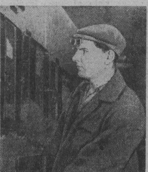
Больше сверхпланового металла Родина! — под таким девизом трудится сейчас коллектив сталелавильщиков печи № 7 первого мартеновского цеха Кузнецкого комбината.