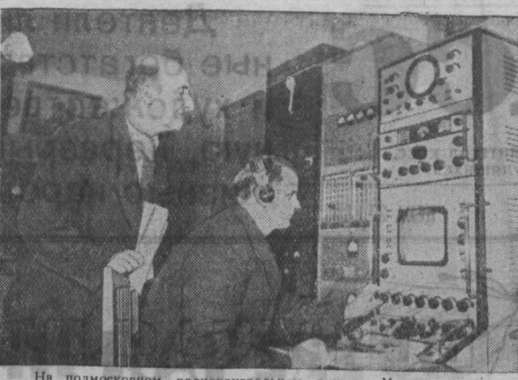
На подмосковном радиоконтрольном пункте Министерства связи СССР в настоящее время проводится напряженная работа по радионаблюдению за искусственным спутником Земли.

Другие радиоконтрольные пункты Министерства связи, расположенные в различных городах страны, также фиксируют нормальноехождение спутника над территорией СССР. Данные радиоконтрольных пунктов представляют большой практический интерес для проводимых научными учреждениями исследований, связанных с движением искусственного спутника Земли.