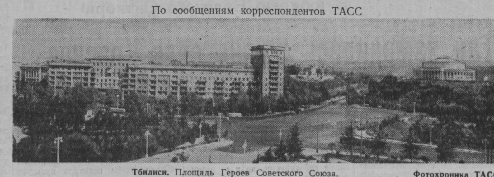
Тбилиси. Площадь Героев Советского Союза.

Алапаевск. Полстопня лет тому назад местные золототкачи обнаружены в долине реки Нейна (Свердловская область) чудесные камешки. Они состояли из тонких волокон, которые и в огне не горели, и в щелочи не таяли. Это были асбестовые руды или уральская куделька, как любовно называли ее первооткрыватели. Сейчас в этих местах раскинулся Алапаевский асбестовый комбинат, оборудованный новейшей техникой — буровыми станками, экскаваторами, мощными автомосавами. Асбеста сейчас здесь вырабатывается за месяц столько, сколько в годы первой пятилетки вылавывали за год. Добытки уральской кудельки успешно несут предоктябрьскую трудовую вахту. 19 октября они начали вылавывать продукцию сверх десятидневной программы.