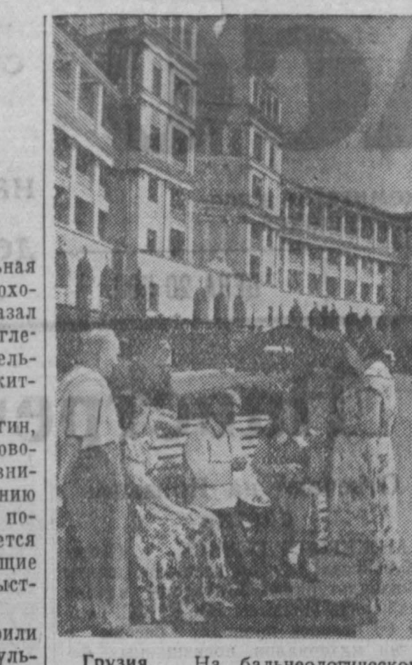
Грузия. На бальнеологическом курорте Цхалтубо.

Непрерывным условием успешной деятельности партии является укрепление единства ее рядов. Еще X съезд РКП(б) принял постановление «О единстве партии», которое и поныне находится на вооружении КПСС. Этим постановлением предписывалось немедленно распустить все без изъятия группировки и вмененные в обязанность всем партийным организациям строжайше следить за недопущением каких-либо фракционных выступлений.