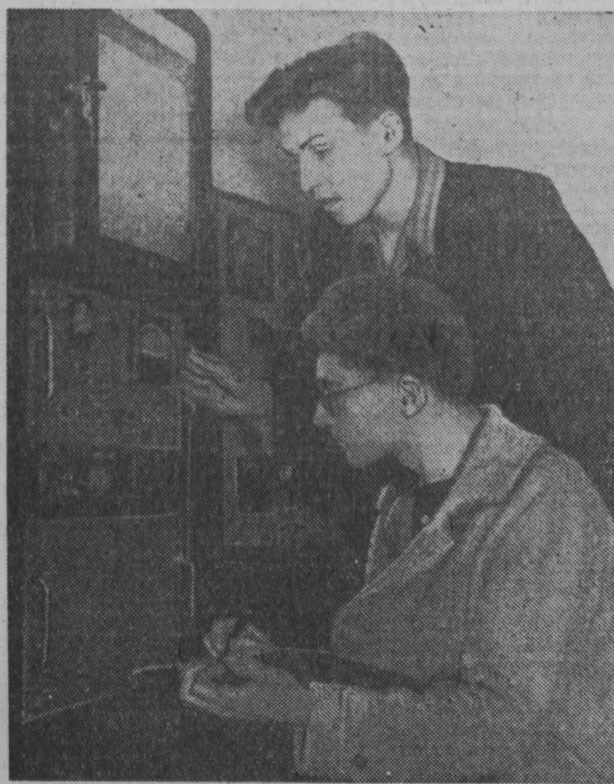
По соседству с Кузнецким комбинатом в Сталинске расположен Сибирский металлургический институт имени Ордена Жданова. Он оснащен хорошими лабораториями, готовят высококвалифицированных специалистов.