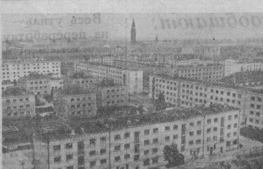
Варшава — самый красивый и благоустроенный город Польской Народной Республики. Все более широкие масштабы принимает здесь культурно-бытовое строительство. В столице сооружены Дворец культуры и науки, театры, кино, спортивные сооружения. Ежегодно варшавяне получают свыше 20 тысяч новых жилых комнат. За последние годы в Варшаве восстановлено и построено около 300 тысяч жилых комнат.

НА СНИМКЕ: общий вид одного из самых больших районов Варшавы Муравна.