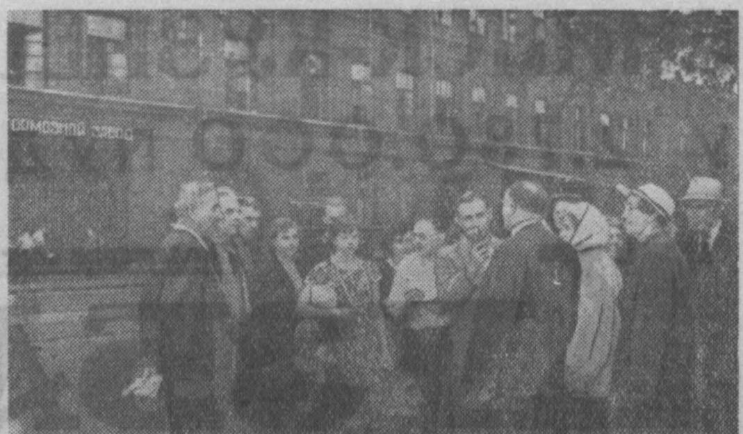
Москва. Группа старых большевиков, участников боев 1917 года в Москве совершила экскурсию по местам революционных событий.