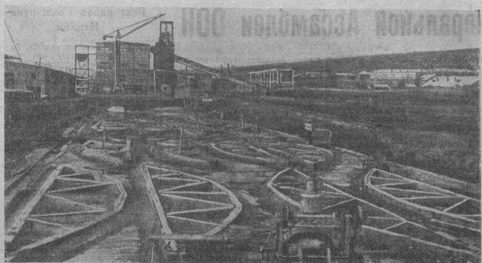
Политон завода железобетонных конструкций треста «Кузнецкжестрой». Здесь изготавливаются предварительно напряженные железобетонные фермы пролетом 27 метров.

Вывод: надо создать в Кузбассе несколько заводов крупных деталей для малоэтажного строительства, а при них — прокатные базы строительных механизмов. Если у горисполкомов не хватит на это средств, то ведь можно кооперировать средства предприятий. Сырье у нас есть (например, в Кемерово шлаки ГРЭС, о которых много шумели, но которые так до сих пор и не используются). Найдется и техника. Тут, кстати, следует рассказать об одном безобразном факте. Года два назад местные организации получили около десятка вибропомпных установок. До сих пор они копят по области, валяются на складах в Ижморке. Проконтроль, Тисуле. Найдется ли у них когда-нибудь настоящих хозяев? И нельзя ли их приспособить для изготовления деталей малоэтажных домов? А. НИКИТИН.