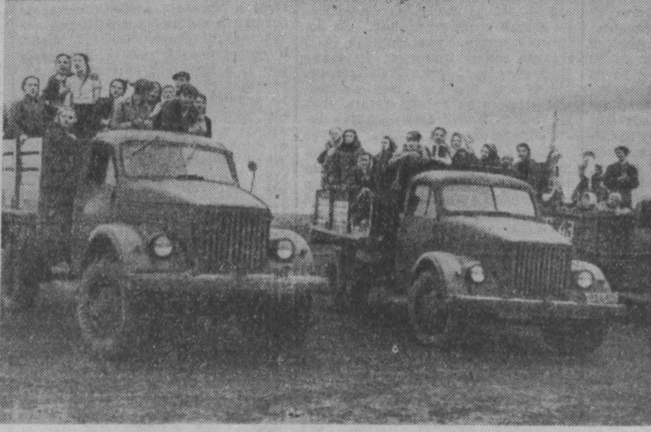
Многие тысячи горожан трудятся в эти дни на полях колхозов и совхозов области, помогая убирать богатый урожай. В первых рядах энтузиастов уборки — молодежь предприятий и учебных заведений. И днем, и ночью, в дождь и в ясную погоду спешат они завершить страду, чтобы собрать хлеб с наименьшими потерями и заслужить горячую благодарность хлеборобов за неоценимую помощь. НА СНИМКЕ: в Мунигетский совхоз, Крапивицкий район, прибыв из областного центра дружный коллектив учащихся школы ФЗО швейной фабрики № 7. Фото А. Курашова.

НА СНИМКЕ: в Мунигетский совхоз, Крапивицкий район, прибыв из областного центра дружный коллектив учащихся школы ФЗО швейной фабрики № 7. Фото А. Курашова.