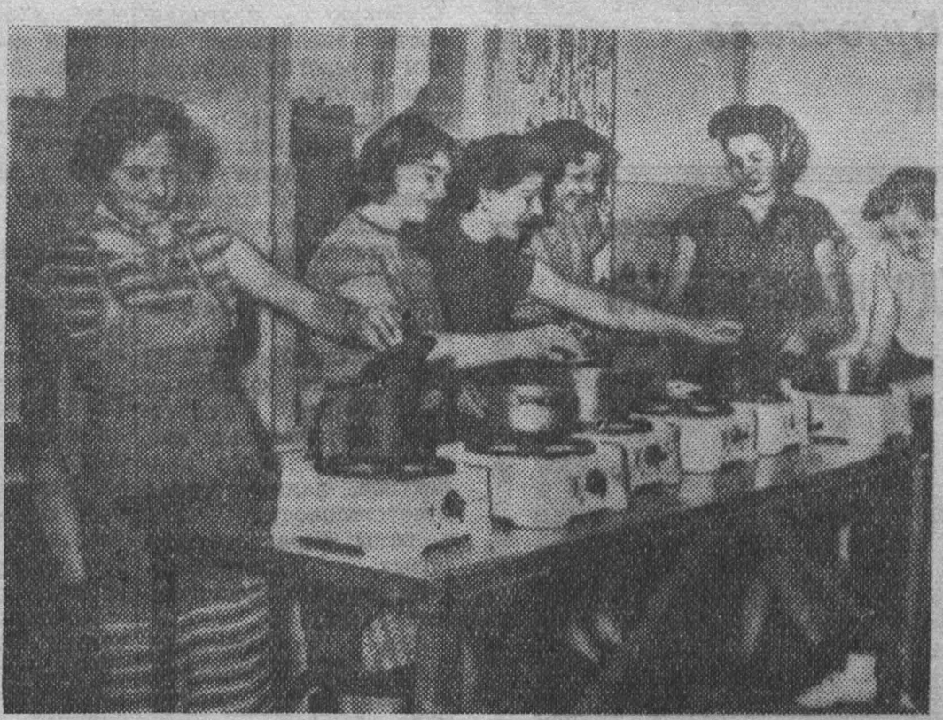
Правительство Германской Демократической Республики проявляет большую заботу о молодом поколении. Принят специальный закон о содействии образованию молодежи, ее работе, спорту и отдыху. Недавно молодые работницы хлопчатобумажной фабрики в Миттгайде получили новое благоустроенное общежитие на 250 человек, где после трудового дня можно как культурно отдохнуть, так и заняться хозяйственными делами.

В. ВАЛОВ, нач. смены доменного цеха Кузнецкого комбината.