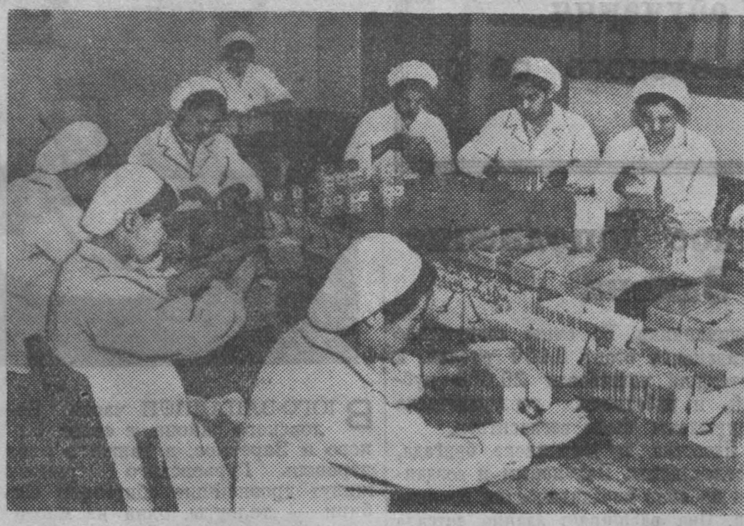
Китайская Народная Республика. В Пекине закончено сооружение крупного завода радиоаппаратуры, оборудованного по последнему слову техники. НА СНИМКЕ: сборка селеновых выпрямителей в одном из цехов завода.

В конце утреннего заседания с речью выступил делегат Албании. НЬЮ-ЙОРК, 13 сентября. (ТАСС). В конце утреннего заседания 12 сен-