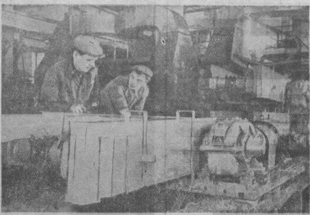
Замечательными трудовыми успехами встречают Новый год машинисты ижжерского завода «Свет шахтера». Выполняя годовое задание 11 декабря, они до конца года дали на сотни тысяч рублей сверхплановой продукции.

После этого мы приступили к сооружению последнего, завершающего звена плотины — ее русловой части. К началу наполнения Иркутского моря предпусковые земляные работы были завершены.