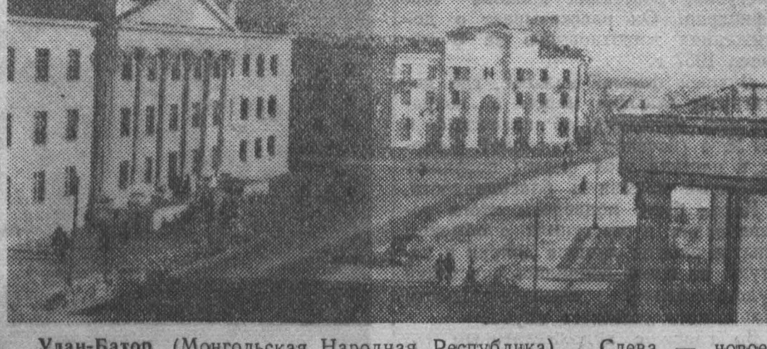
Улан-Батор (Монгольская Народная Республика). Слева — новое здание Государственного центрального музея.

«Товарищ ремонтник! Простой рабочий в течение 30 минут успевают произвести работу в 70 процентов и вызывают дополнительные расходы по 630 рублей в год на одного рабочего!»