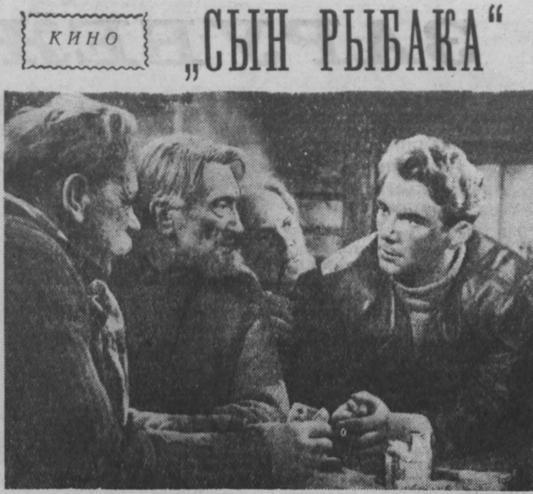
Роман В. Лациса «Сын рыбака» пользуется заслуженной любовью у широкого круга читателей. В нем писатель правдиво и живописно рассказывает о трудовой жизни рыбака буржуазной Латвии, о их борьбе за лучшую жизнь.