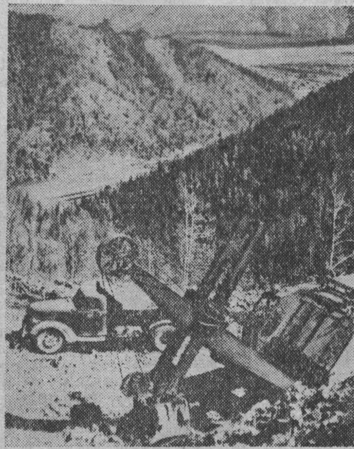
Бесперебойно ведутся вскрышные работы на Абаканском руднике. Более миллиона кубометров породы уже убрано, рудное тело местами обнажено. Но для того, чтобы обеспечить устойчивую добычу руды в больших размерах, темпы вскрышных работ необходимо значительно увеличить. Для этого горнякам предоставлена лучшая техника.