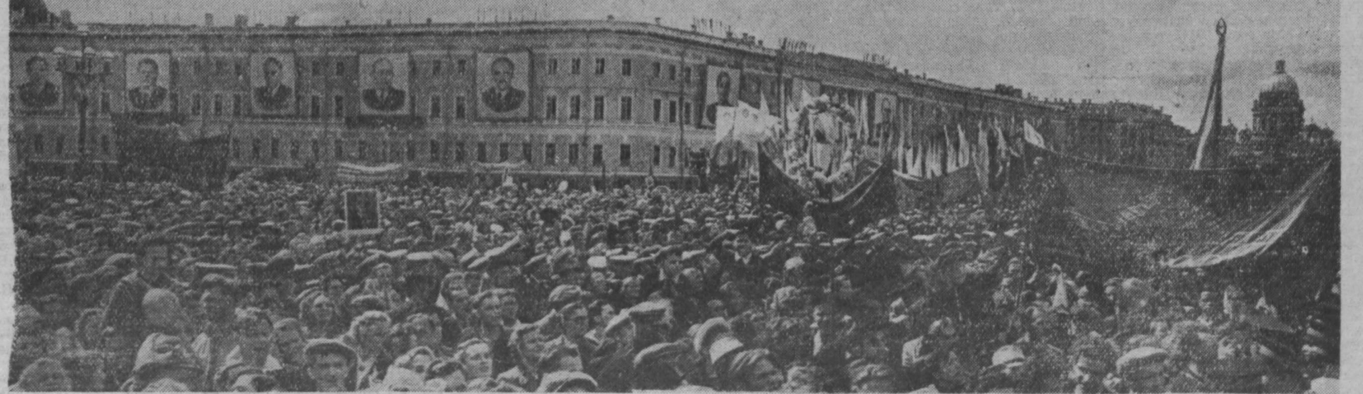
Ленинград, 7 июля 1957 года. Демонстрация трудящихся на Дворцовой площади.

Была достигнута договоренность, что о визите Партийно-правительственной делегации Советского Союза и о совместных беседах будет опубликовано совместное коммуни-