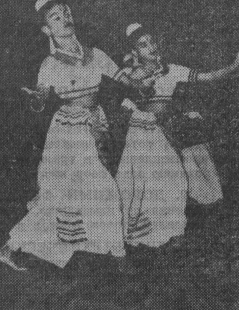
Коломбо. Народный трупп «Пантеру» в исполнении цейлонских артистов.

М. Зюнова, дежурный stenografist. Редактор Ф. Е. ДЕМИН.