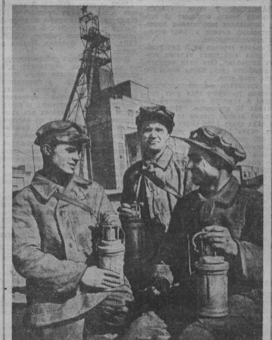
Горняки шахты № 21 имени Хрущева с честью выполняют свои предквартальные социалистические обязательства...