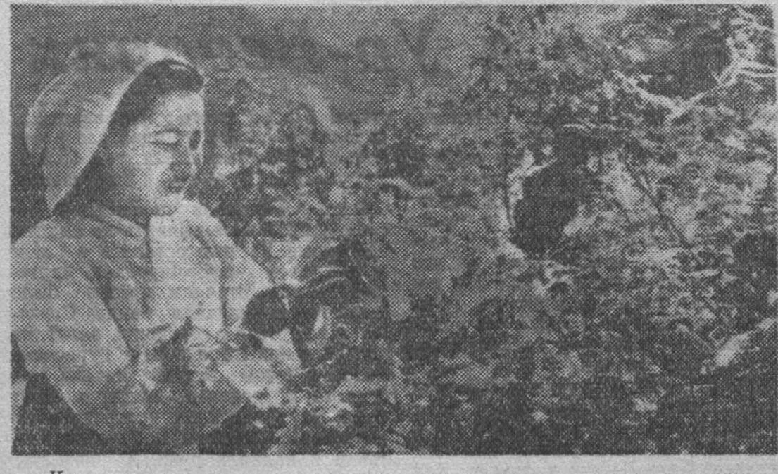
Крепнут и развиваются сельскохозяйственные производственные кооперативы в Корейской Народно-Демократической Республике...