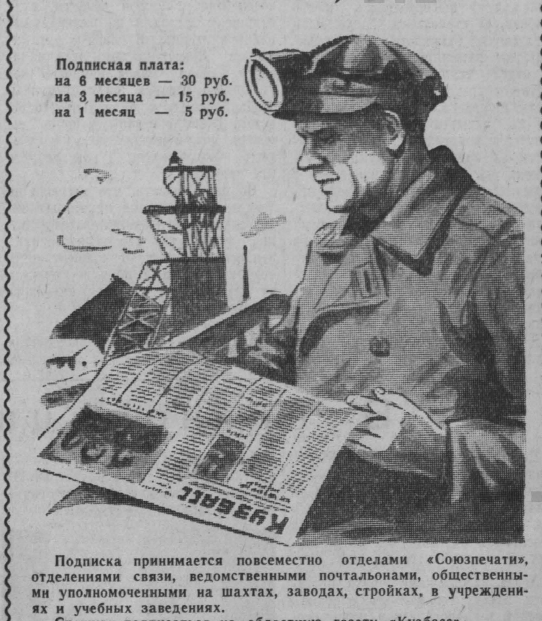
Подписка принимается повсеместно отделами «Союзпечати», отделениями связи, ведомственными почтамтами, общественными уполномоченными на шахтах, заводах, стройках, в учреждениях и учебных заведениях. Спешите подписаться на областную газету «Кузбасс».

ПРОДОЛЖАЕТСЯ ПОДПИСКА на газету «КУЗБАСС» на 2-е полугодие 1957 г.