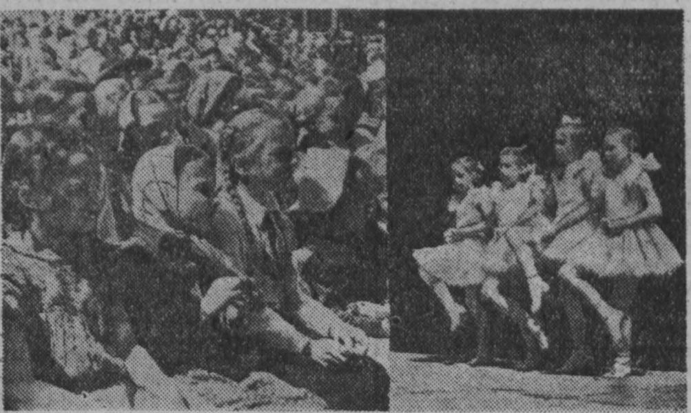
Танец маленьких лебедей из балета Чайковского «Лебединое озеро» в исполнении хореографического коллектива Кемеровского Дома пионеров. Слева — юные зрители.

1 июня с утра до вечера веселились школьники в городском саду, празднуя Международный день защиты детей.