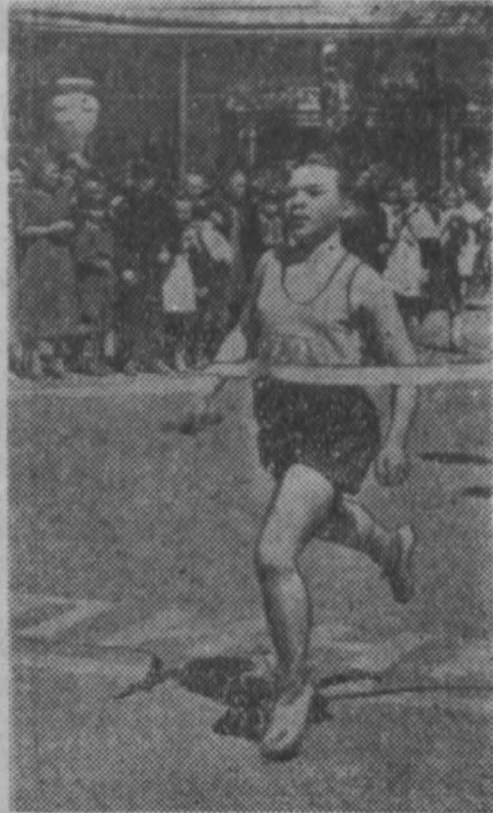
Финиширует представитель школы № 23.

День выдался безоблачный, теплый. С утра в городской сад начали собираться школьники. Мальчики и девочки пришли сюда в своих лучших нарядах, и от них зеленые аллеи красиво расцвели. Зеленый театр. С успешным окончанием учебного года учащиеся поздравляют представителя горкома ВЛКСМ, городского отдела народного образования и школ.