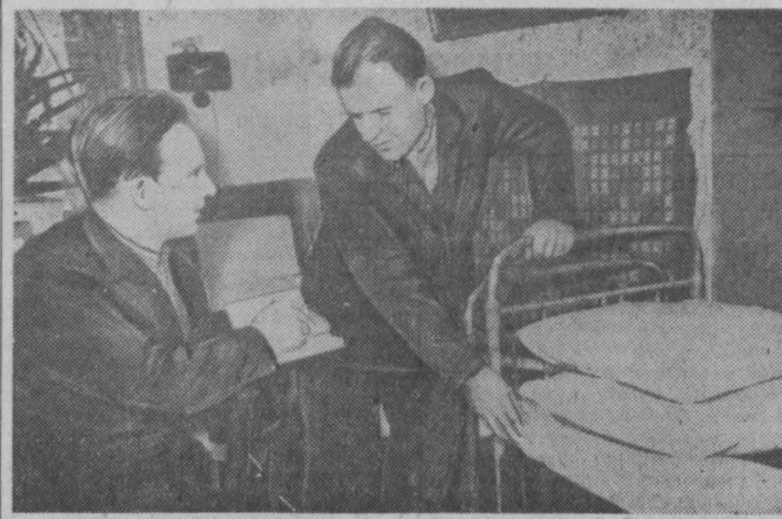
Чисто и уютно в общежитии № 20 горняков шахты «Физкультурник» Анжерского рудника. В красном углу всегда свежие газеты, журналы. Активную работу среди жильцов ведет совет общежития, в который входят лучшие производственников.