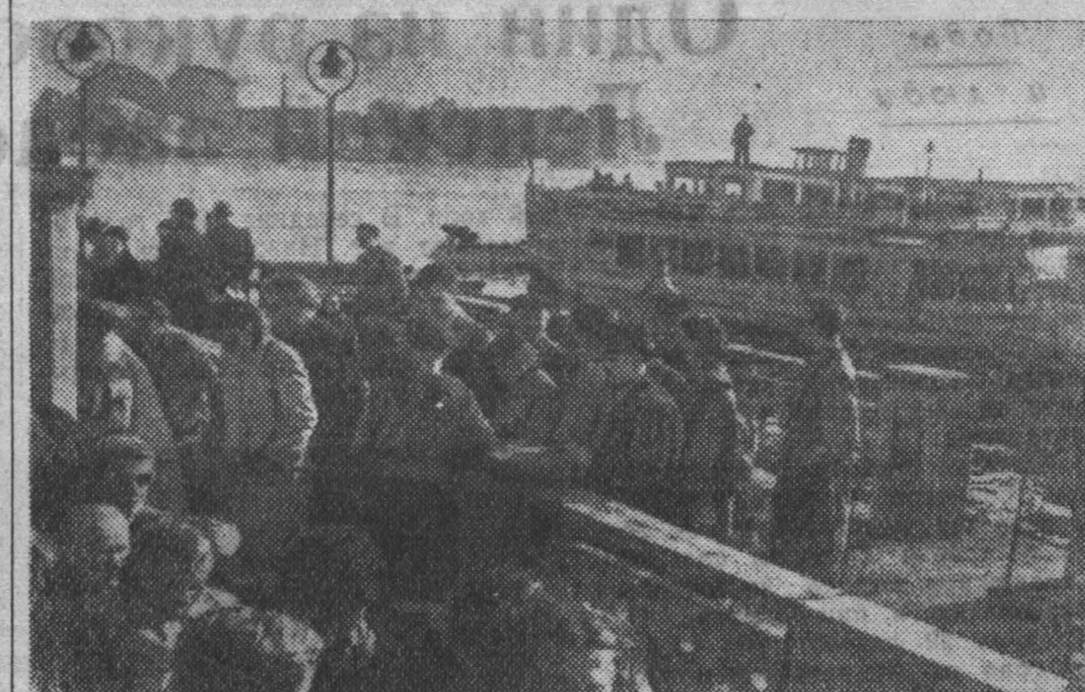
Излюбленным отдыхом жителей столицы Германии Берлина и приезжающих сюда многочисленных иностранных гостей являются прогулки на речных пароходах по Шпрее.

Технологическая недисциплинированность отрицательно сказывается на качестве сырья. Например, на Шальмьском руднике долгое время