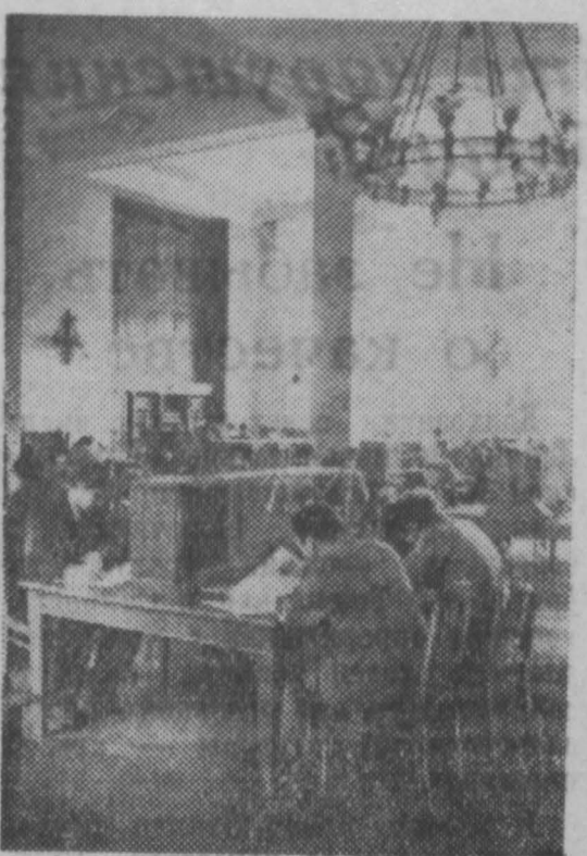
Москва. В Государственной библиотеке СССР имени В. И. Ленина открыт новый — главный корпус, — в трех этажах которого размещены специализированные читальни залы по различным отраслям знания. К услугам читателей систематический и алфавитный каталоги на 7 миллионов карточек на языках народов СССР и иностранных, подсобные библиотеки справочной литературы и книг, пользующихся наибольшим спросом у читателей. Открытие нового корпуса, обшая площадь которого превышает 11 тысяч квадратных метров, позволит библиотеке обслуживать ежедневно 5—6 тысяч читателей.