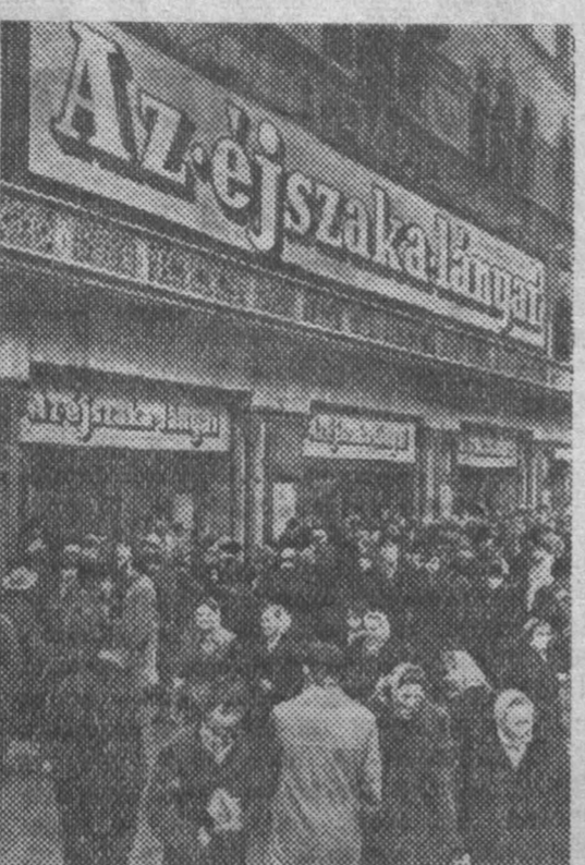
Будущее сегодня. У кинотеатра «Урания».