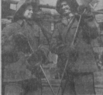
Сталинская область. Доменщик Сталинского металлургического завода в шестой пятилетке повышает выплавку чугуна на 93,5 процента.

Хорошо работает коллектив пеха в первом году пятилетия. На его счету уже значится свыше трех тысяч тонн чугуна, выплавленного сверх плана. Недавно доменщик выступил с предложением достичь за три года уровня выплавки чугуна, запланированного на конец 1960 года.