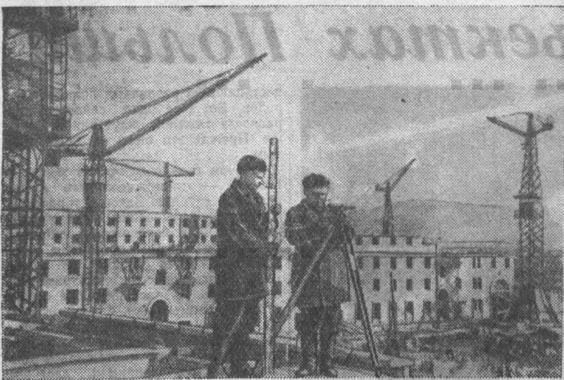
В Сталинске ведется большое строительство жилых домов, культурных и детских учреждений. В шестой пятилетке в городе будет построено около 700 тыс. квадратных метров жилой площади, больничный городок, театр на 1100 мест, несколько школ.