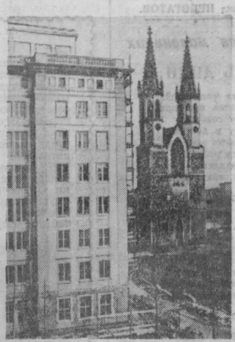
Германская Демократическая Республика. Строительство дома в Магдебурге.

У исполнителей центральной роли артиста Л. Бикова, Максима Перепелицы и артиста Ивана Бровкина много одинакового (и того и другого считают вначале «пугульками», потом в дружном армейском коллективе мужают и закаливаются их характеры), герой фильма А. Граника ничем не похож на персонажа из сценария Г. Мдивани.