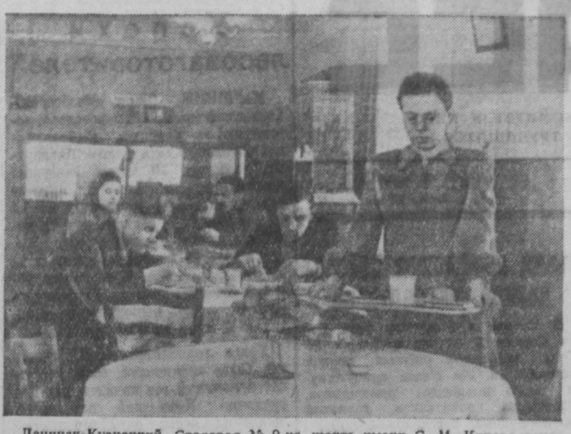
Ленинск-Кузнецкий. Столовая № 9 на шахте имени С. М. Кирова. На снимке: в столовой во время обеда.

А. САНАЕВ, секретарь Зенковского райкома КПСС г. Прокопьевска.