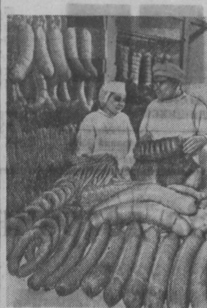
Молдавская ССР. Бендерский мясокомбинат — одно из крупнейших предприятий пищевой промышленности республики. Комбинат успешно завершил задание первых двух месяцев. За годы шестой пятилетки выпуск готовой продукции возрастет в два раза.