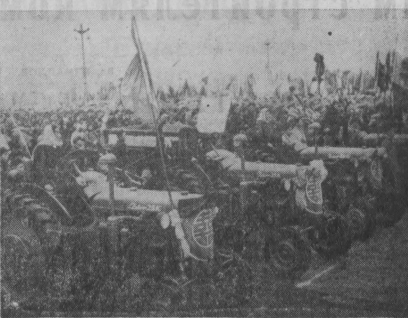
Китайская Народная Республика. В связи с успешным завершением социалистических преобразований частных промышленных и торговых предприятий в смешанные государственно-частные в важном промышленном и торговом центре Китая — Шанхае состоялся массовый митинг, праздничные демонстрации и гуляния.

План финансирования вооружения западно-германской армии. В 2,5—3 миллиарда марок. Планом предусматривается ассигновать на формирование 12 западно-германских дивизий в 1955—1956 бюджетном году 5,5 миллиарда марок.