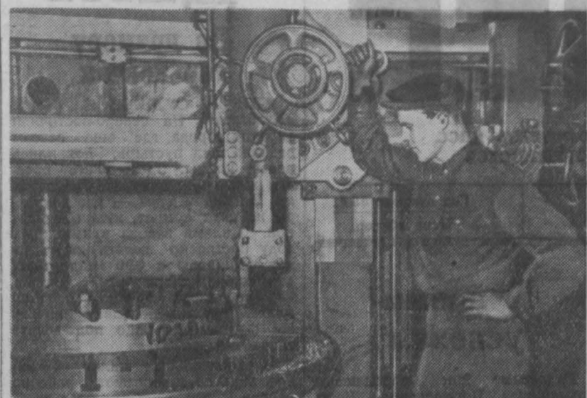
Коллектив анжеро-судженского завода «Свет шахтера» на десять дней раньше срока завершил выполнение годового плана. Машинистами решено до конца месяца дать сверх плана продукцию на несколько миллионов рублей.

Существенным недостатком является и то, что в ряде колхозов допускаются большие расходы коров. В сельхозартеле Бусевского и Тяжинского районов она доходила до 10 процентов. В 1957 году в среднем по колхозам на каждую фуражную корову необходимо получить не менее 1.800 кг молока, причем за вятный период — не менее 800 кг. Выполнение этой задачи будет зависеть от организации содержания скота зимой. Зимовка в животноводстве — очень важная и ответственный период. Итоги первых месяцев стойлового содержания скота показывают, что во многих колхозах и совхозах допускаются серьезные недостатки, которые значительно снижают про-