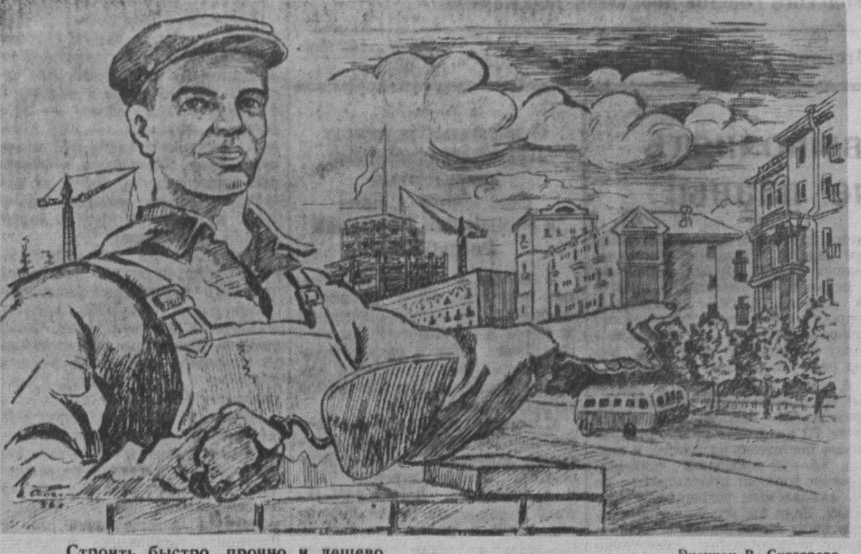
Строить быстро, прочно и дешево.

Коллектив нашей молодой лаборатории обогащения ВНИИ-гидроугля пришлось заняться очень сложной проблемой — отсадкой неклассифицированного угля. Дело в том, что в стране, из-за нехватки некоторых «вредных» специалистов-обогатителей, эта проблема не решалась, хотя и имеет большое народнохозяйственное значение. Решение ее должно послужить основанием для применения прогрессивной однофазной схемы обогащения. Лабораторией организованы экспериментальные работы по отсадке неклассифицированного угля в промышленных условиях на обогатительной фабрике «Зиминка-3-4» с одновременным испытанием воздушно-распределительных устройств отсадочной машины — пульсаторов «ПВ-2». В содружестве с работниками треста «Кузбассуголь» и фабрикой «Зиминка-3-4» в настоящее время проводятся многочисленные опыты на отсадочной машине обычной конструкции, затем — на реконструированной. Результаты проведенных опытов доказали возможность обогащения углей средней и весьма трудной обогатимости в неклассифицированном виде, а также преимущество этого метода перед обогащением классифицированного угля. При равных качественных показателях выход концентрата при обогащении неклассифицированного угля повышается на 2—4 процента. Кроме того, эта отсадка обеспечивает внедрение отходной схемы обогащения, что, в свою очередь, позволяет сократить потребление оборудования фабрики в 2—3 раза. Ф. КОГУС, горный инженер.