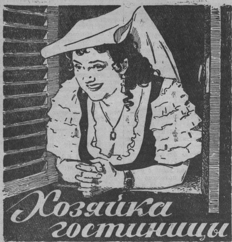
«Хозяйка гостиницы» (по комедии Карло Голдони)

Смотрите на экранах кинотеатров, дворцов культуры и клубов Кузбасса фильм-спектакль