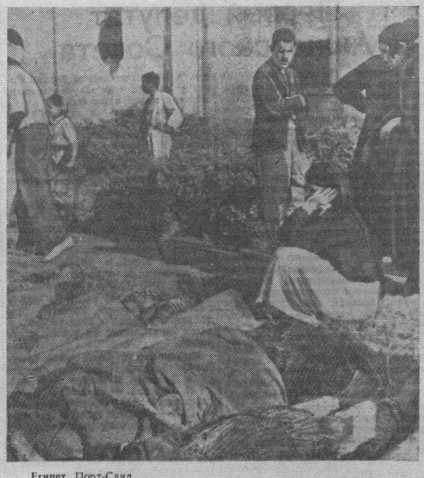
Египет. Порт-Саïд. НА СНИМКЕ: жертвы англо-французской агрессии.