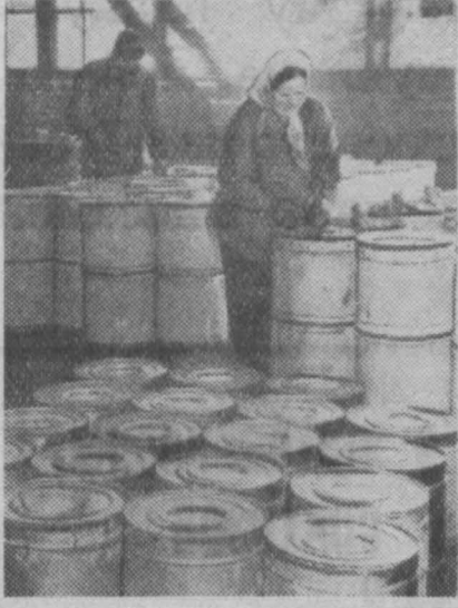
Продукция Кемеровского англо-красночного завода идет далеко за пределы Советского Союза — в Индию, Китай, Польшу, Аргентину, Бельгию, Голландию.