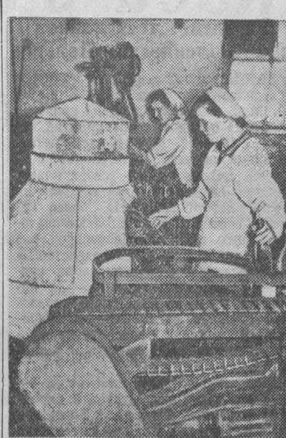
Прокопьевский ливаренный завод...