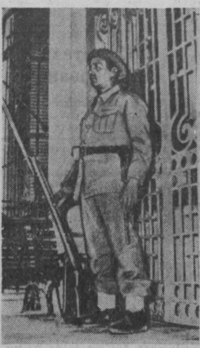
Порт Сейд. Египетский часовой у здания национализированной компании Суэцкого канала.