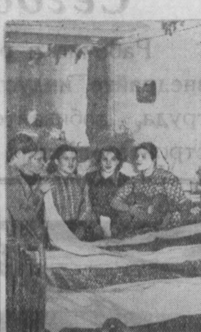
Беловская ГРЭС. Молодые строители из Липецкой области в общежитии.