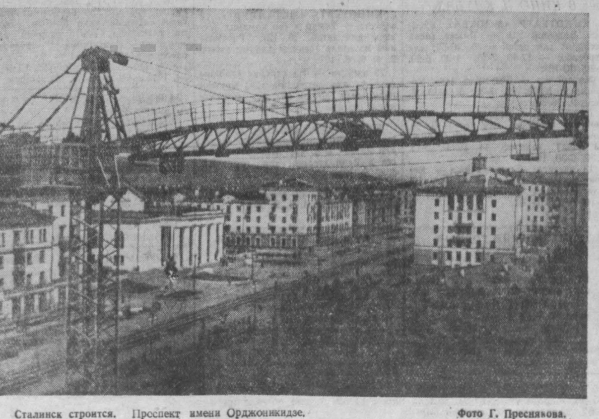
Сталинск строится. Проспект имени Орденовцев.

Готовят опалубку и ведут бетонирование плотники бригады Тимофеева, работающие на стройке котельной. Среди коллектива нет ни одного рабочего, выполняющего меньше 150 проц. нормы.