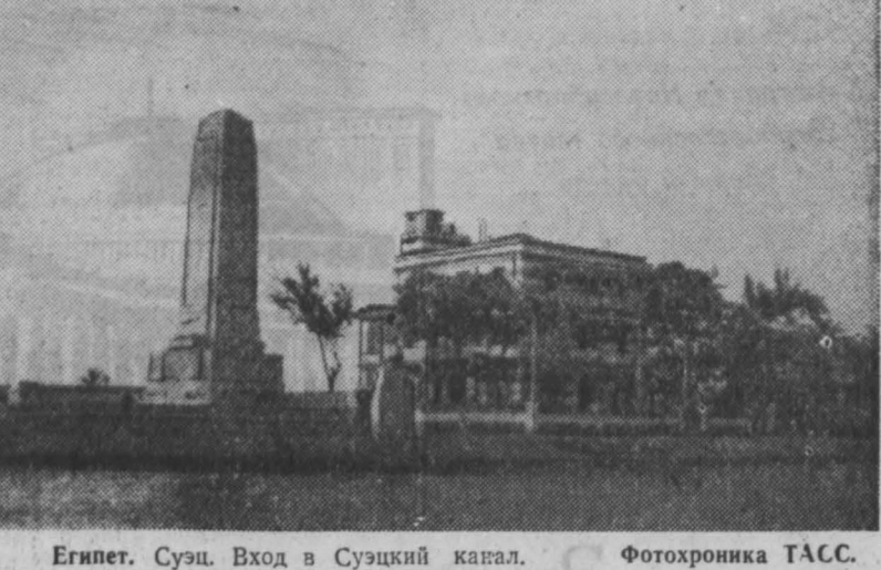
Египет. Суэц. Вход в Суэцкий канал.