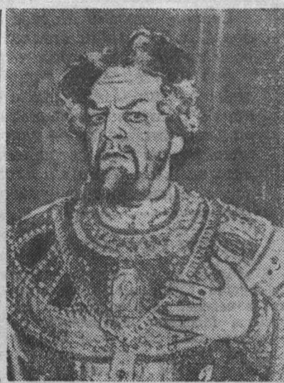
Народный артист РСФСР В. П. Аркянов в роли Бориса Годунова.