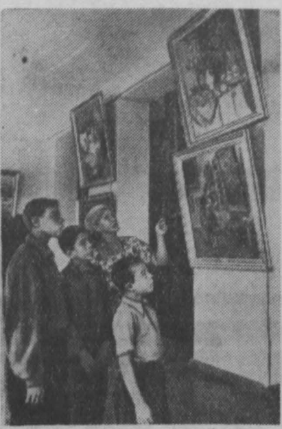
Более трех тысяч комсомолцев посетили выставку московских художников, размещенную в клубе ГРЭС. Выставка периодически обновляется новыми картинами. Здесь можно встретить и студентов, и школьников.

Большое дело творится на Советском Востоке. Там создается новая промышленность, закупаются орудия электростанций. Бурный расцвет как влетел подым науки, что в свою очередь приводит к огромным сдвигам в производстве. От тесного единения науки и практики в значительной мере зависит успешная реализация величественного плана поема экономики и роста удельного веса восточных районов в общем народнохозяйственном развитии нашей социалистической Родины. (ТАСС).